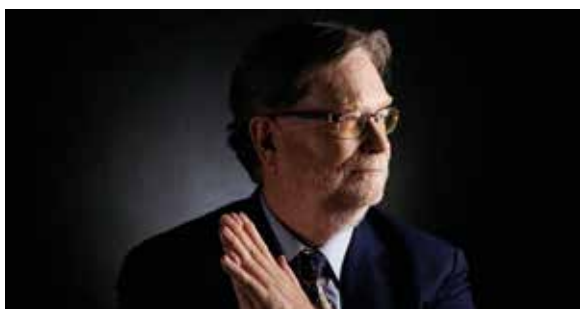
George F. Smoot, 2006ko Fisikako Nobel sariduna