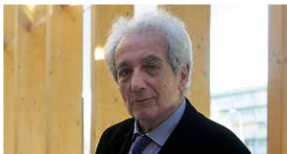
Albert Fert, 2007ko Fisikako Nobel sariduna