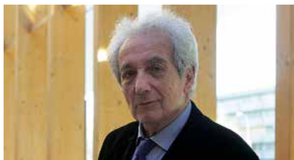
Albert Fert, Premio Nobel de Física 2007